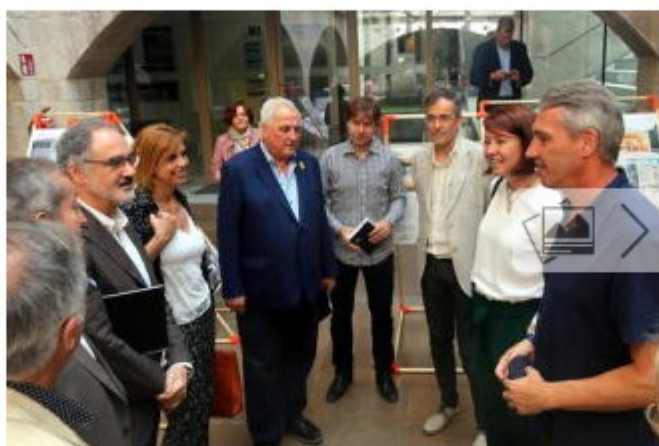
Representants del sector amb els alcaldes de Figueres, Olot i